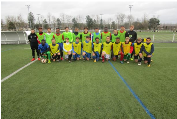
GRUPE JOUEURS U15