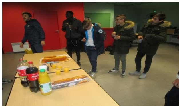
MOMENT DE CONVIVIALITE