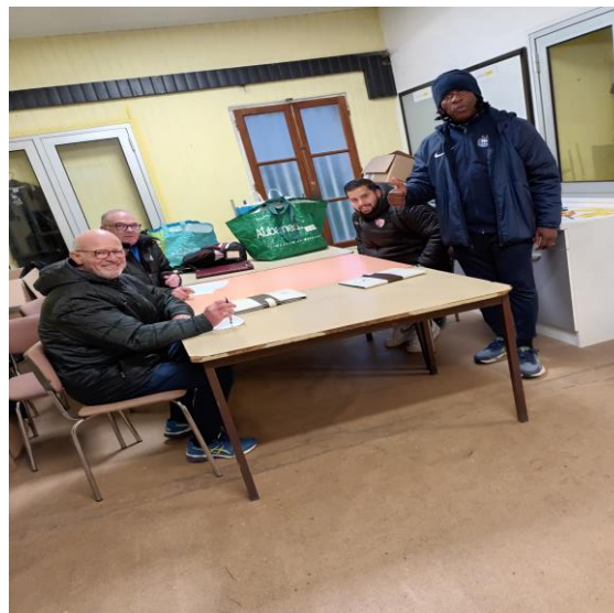
DEBRIEFING DU STAFF