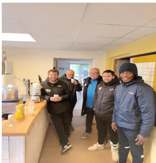
ACCUEIL DU STAFF AU CAFE AVEC LE PRESIDENT DU CLUB