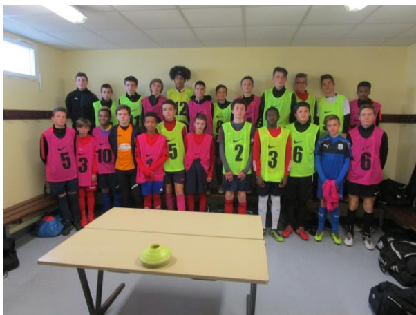
GRUPE U14 DANS LES VESTIAIRES