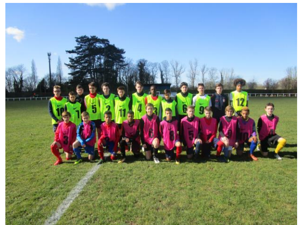
GRUPE U14 SUR LE TERRAIN