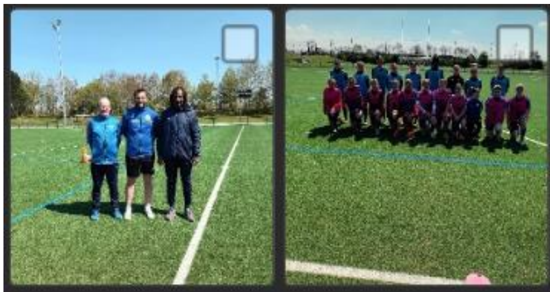
Photos Encadrements + Joueuses