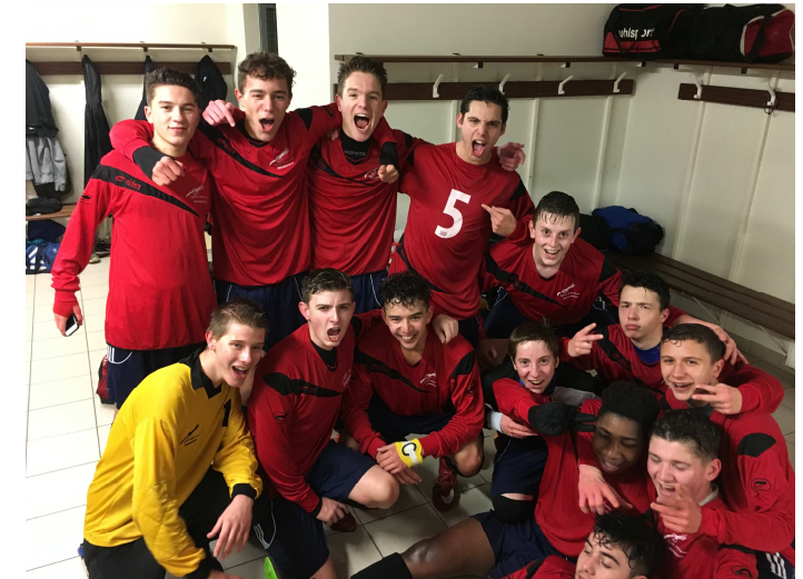
Section Sportive Football 2017-2018