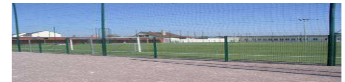
Stade Jean Tocquer de Mondeville (terrain synthétique et fosse synthétique nouvelle génération)